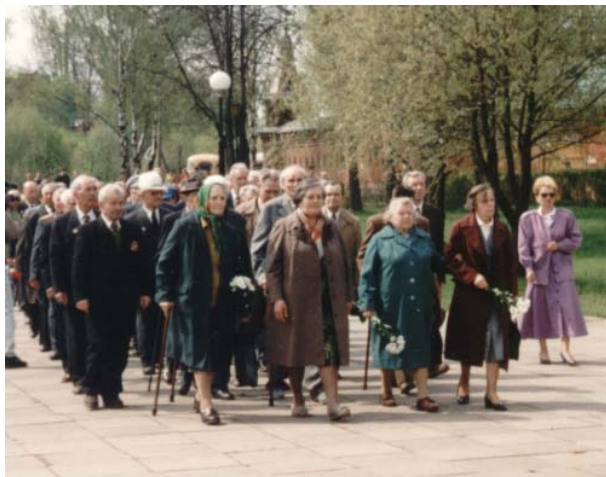
Пенсионеры идут на парад в День Победы

Пожилые люди в Российской Федерации привыкли к скромной жизни в советское время. В старости, как правило, они живут ещё скромнее.