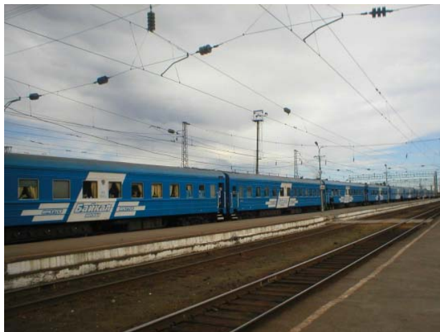
Поезд «Байкал» на вокзале в Иркутске

Read the passage. Decide where you think the stress marks should be. Then check your version against the recording.