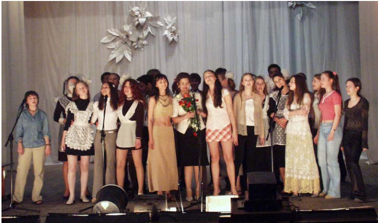
Выпускной вечер в гимназии в Омске