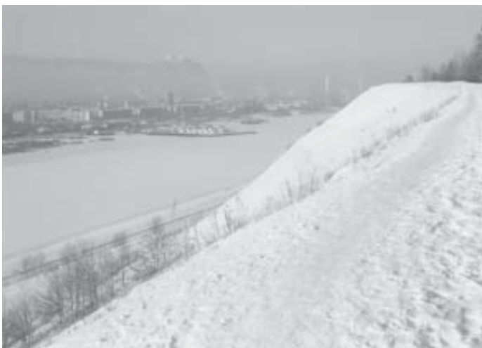
Река Волга. Нижний Новгород. Зима. На противоположном берегу реки видны индустриальные районы.

Река Волга - это "главная улица России". Она начинается в Тверской области и впадает в Каспийское море. Её длина 3531 километр. Летом по Волге ходят современные туристические теплоходы, и от Москвы (сначала по реке Москве) можно доплыть до Астрахани. Это очень популярный маршрут. Вы увидите такие города, как Ярославль, Костромá, Нижний Новгород, Самáру, Сарáтов, Волгоград, Казáнь и Ульяновск.