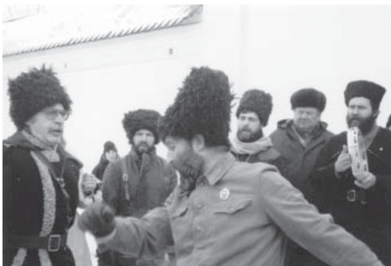
На прázднике. Каза́ки танцуют. А как они вы́глядят?

Die CD-ROM Ruslan 2, Lektion 9 umfasst 35 interaktive Übungen mit Ton, darunter auch Videoübungen.