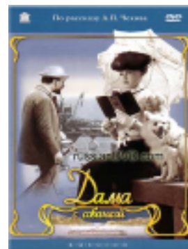
Дама с собачкой

белая краска - большо́й интере́с - горя́чий чай - гро́мкий го́лос дли́нные во́лосы - коммуни́сты - лук - моско́вский Спарта́к - роди́тели